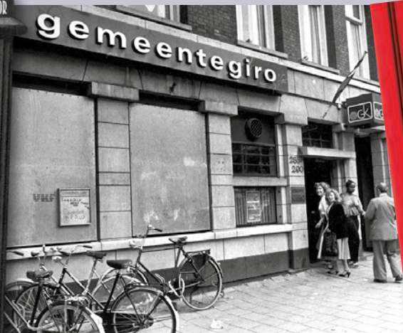
Het oude kantoor aan de Ceintuurbaan.