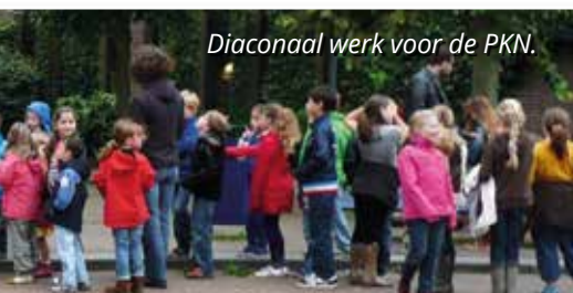
Diaconaal werk voor de PKN.

Meer over het Kijk- en luistermuseum zie www.kijkenluistermuseum.nl . En over de Stichting Kabinetorgel www.kabinetorgelbennekom.nl .