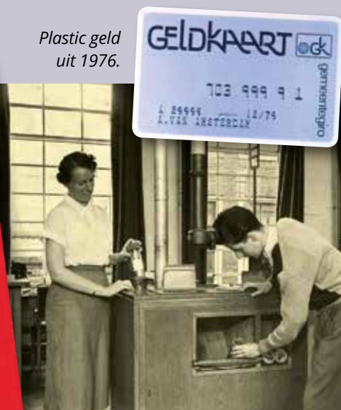
Kantoor Oudezijds Voorburgwal.