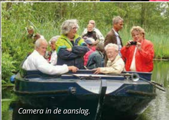
Camera in de aanslag.