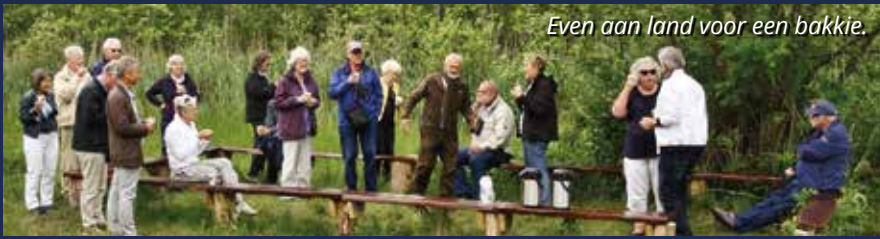
Even aan land voor een bakkie.